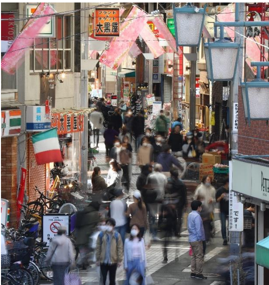
商店街では買い物に大勢が密集した【時事】