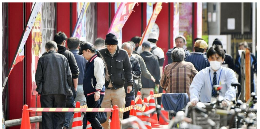
休業要請に応じないパチンコ店には長蛇の列ができた