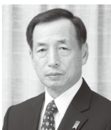
講師 第29代航空幕僚長 田母神俊雄氏

昭和23年福島県生まれ。防衛大卒業後、航空自衛隊に入隊。平成19年、航空幕僚長に就任。