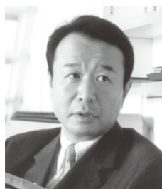
講師 株式会社独立総合研究所 代表取締役社長 兼 首席研究員 青山繁晴氏

11月参議院防衛委員会に参考人招致されたが、論文内容を否定するつもりはないことを改めて強調した。